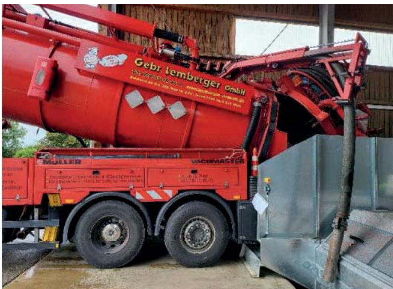
Fahrzeug beim Spülen

Ein großmaschiger Gitterrost im Bereich der Aufgabefläche verhindert einerseits, dass größere Materialstücke in die Anlage gelangen, andererseits wird damit den UVV-Vorschriften Rechnung getragen.