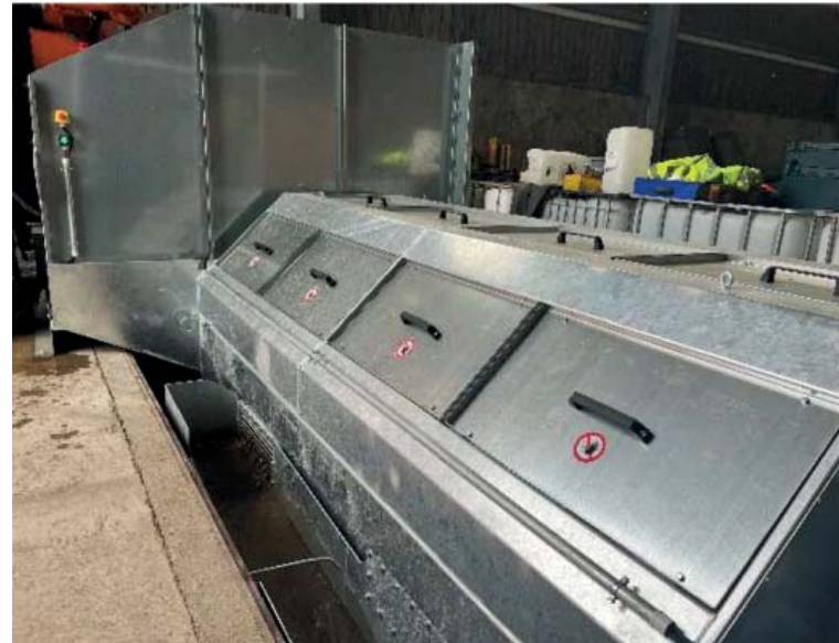
Recyclinganlage mit Auslaufrinne

Gleichzeitig wird die Kammer im Gegenstromprinzip mit Wasser durchströmt. Dabei werden die organischen Bestandteile sowie die mineralischen Bestandteile \leq 250 \mu\text{m} ausgewaschen und zusammen mit dem überschüssigen Prozesswasser über eine Auslaufrinne abgeleitet.