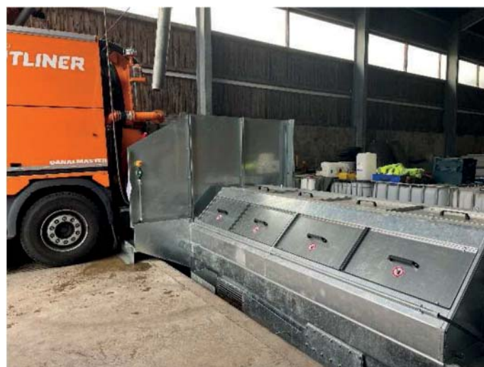
Fahrzeug beim Spülen

Mit dem gelieferten BIBKO® INFRA-TEC-Recyclingsystem, konnten die im Vorfeld festgelegten Parameter vollständig erreicht werden. Dies führt nun im täglichen Betrieb zu reduzierten Kosten und macht den Kauf des BIBKO® INFRA-TEC - Recyclingsystems zu einer nutzbringenden Investition.