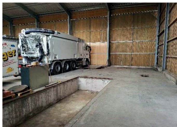
Halle mit Vertiefung im Boden

Als Aufstellposition in der Halle sollte die bereits vorhandene Vertiefung dienen. Die konstruktive Ausführung des Recyclingsystems wurde hierzu entsprechend angepasst, sodass eine versenkte Aufstellung möglich wurde. Diese ermöglicht die optimale Entleerung der Fahrzeuge.