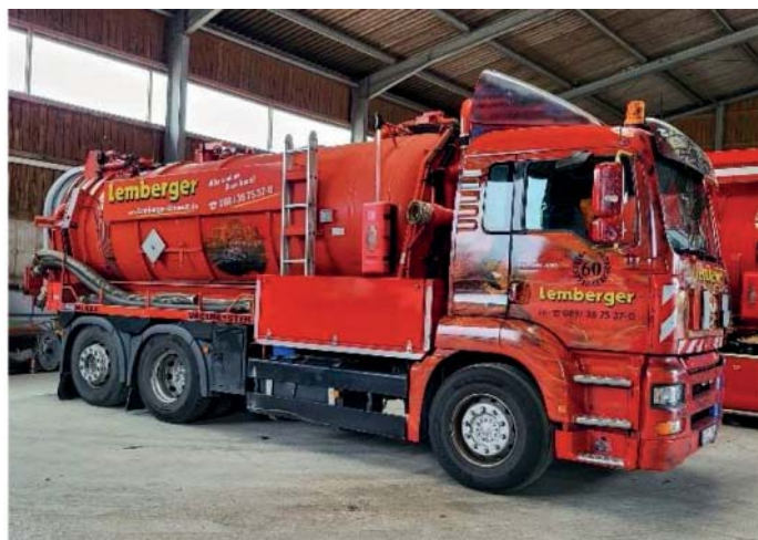
Spülfahrzeug Gebr. Lemberger

Die Firma Gebr. Lemberger Entsorgungs- und Abwassertechnik GmbH ist ein Familienunternehmen mit Sitz in München, das im gesamten bayrischen Raum seine Dienstleistungen anbietet. Hierzu gehören neben der Reinigung von Abflüssen, Rohren und Kanälen auch die Entsorgung von Flüssigabfällen.