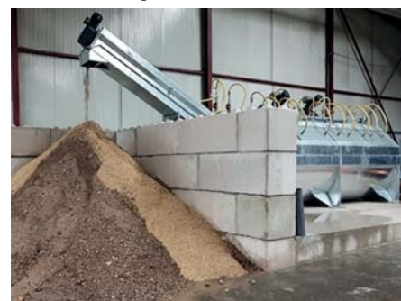
Material nach Recyclingbox in Materialbox

Ein zweites Becherwerk entnimmt das gewaschene Material aus der Hauptwaschkammer und führt es dem Wendelförderer zu. Über diesen Förderer wird das Material entwässert und in die Materialbox gefördert.