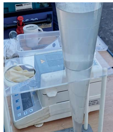
Filtrat nach Filtrationsprozess