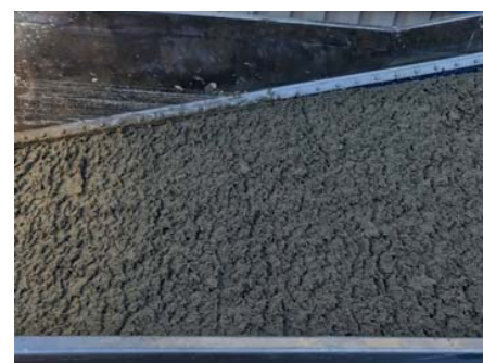
Filterkuchen auf Vakuumbandfilter

Das entstandene Filtrat zeigte nur noch eine sehr geringe Trübe.