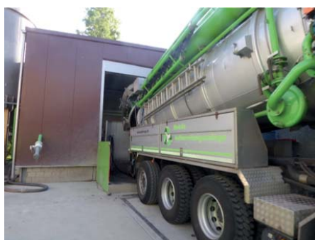
Entleervorgang an der BIBKO®-Recyclinganlage

Bentonite sind aufbereitete Tone aus natürlichen Vorkommen, die in Wasser suspendiert von großer praktischer Bedeutung für den Spezialtiefbau sind. Die Bentonitsuspensionen haben hierbei die Aufgabe Bohrlöcher zu stabilisieren und das Bohrgut zu transportieren. Durch diese Eigenschaften kommen Bentonitsuspensionen u. a. bei Horizontal- und Geothermiebohrungen, aber auch beim Bau von Schlitz- und Dichtwänden zum Einsatz.