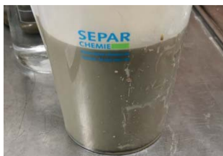
Betonitsuspension – unbehandelt

Für ein Neuprojekt wurden in einem ersten Schritt Filtrationsversuche zur Ermittlung des richtigen Fällungs- und Flockungsmittels durchgeführt.