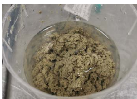
Betonitsuspension – gefällt und geflockt

Die Bentonitsuspension wurde ursprünglich als Stützflüssigkeit beim Bau von Schlitzwänden verwendet. Da diese ihre ursprünglichen Eigenschaften nicht mehr hatte, sollte diese recycelt werden.