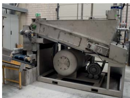
Vakuumbandfilter im Einsatz

Nachdem der Bentonitsuspension das optimale Fällungsmittel und Flockungsmittel zugesetzt wurde, erfolgte im nächsten Schritt die Zuführung der geflokkten Suspension in den Vakuumbandfilter.